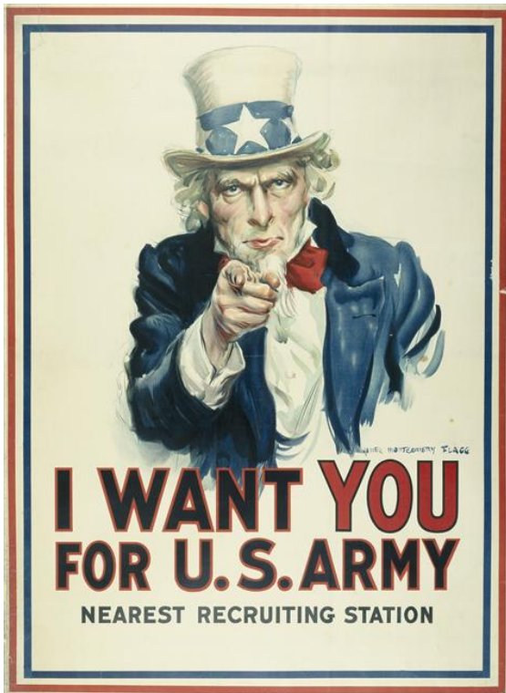
Affiche I Want you for U.S. Army 06-505737