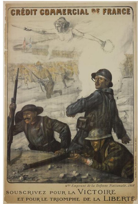
4 e emprunt national. Souscrivez 16-546443

Envoie ton affiche à : jeunes@musee-armee.fr