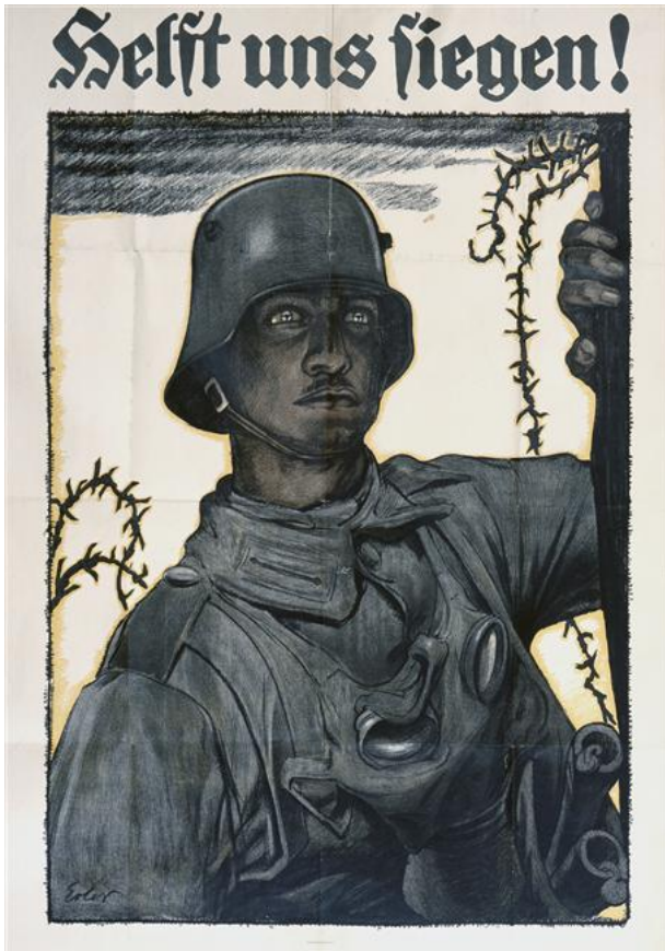
Helft uns Siegen ! [Aidez-nous à triompher !] 06-502439

Voici deux autres exemples d'affiches de la Première Guerre mondiale, l'une allemande, l'autre française. Tu peux observer ainsi comment chaque pays représente ses soldats et quelles couleurs sont utilisées à cette époque.